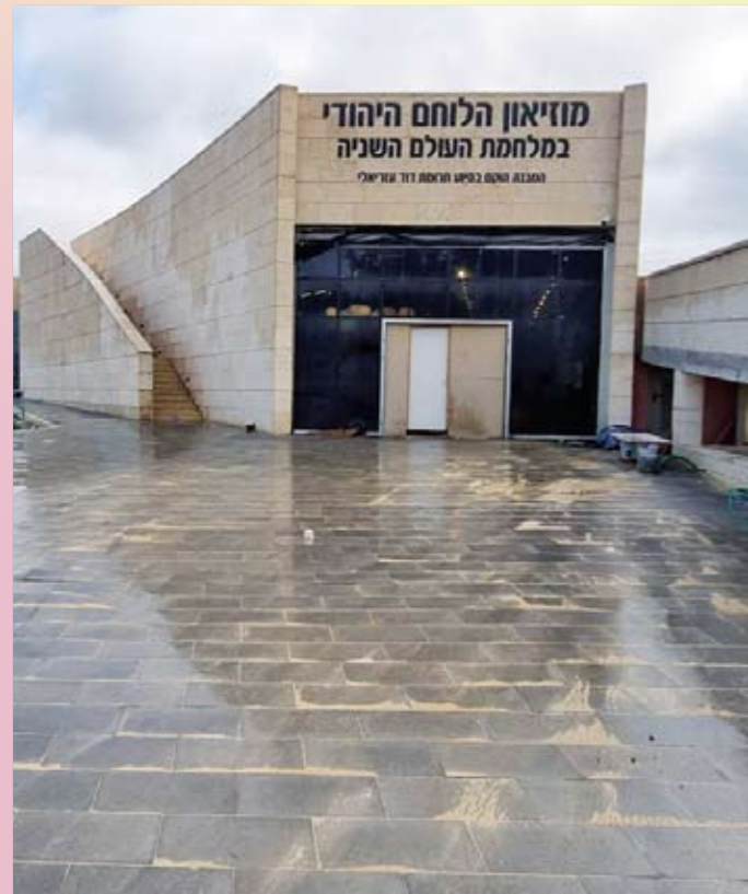
Идёт строительство музея

Каждый из залов нового Музея посвящен героическому участию воинов – евреев в боевых действиях и решающих сражениях, которые вели армии ведущих стран антигитлеровской коалиции: СССР, США, Великобритании, а также других государств. Отведены также помещения для учебных классов, семинаров и конфе-