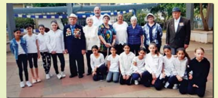
Фронтовики и люди, пережившие Катастрофу, постоянно на связи со школой Тель-Хай