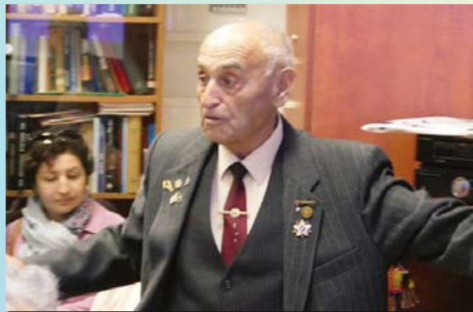
Президент о планах и бюджете

По принятому правилу «Продолжение следует» президент пожелал достойно отметить следующие День Независимости, День Победы, открытие Музея в Латруне, предстоящий выпуск