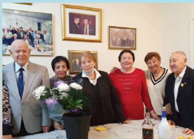
Женсовет рапортует ЦК Союза об успехах и заботах. 7.03.2022. Реховот

очередного журнала, чествование юбилярво-долгожителей, семейные торжества.