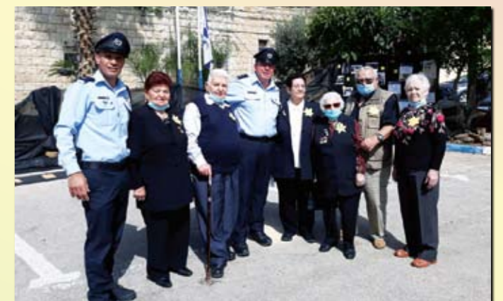
Полиция Кирият-Шмоны на День Катастрофы с «Узниками гетто»