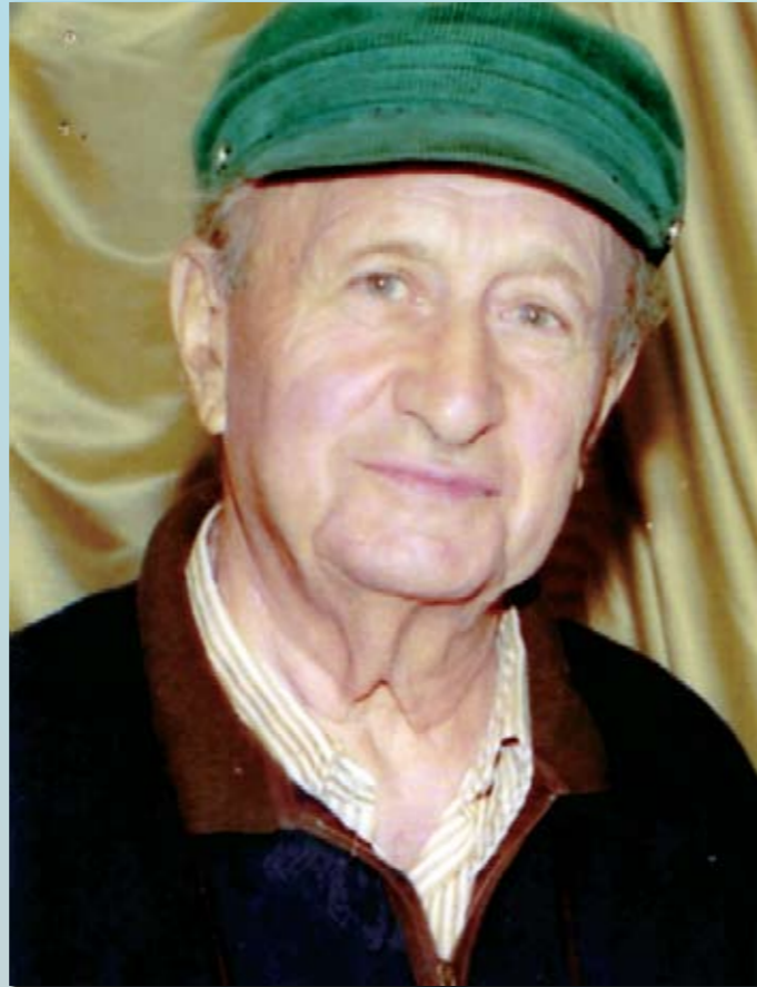
А. Тимор. Случайный незадолго до кончины дружеский снимок.

Незадолго до конца войны, проходя через Польшу, под Старгардом освобождали узников