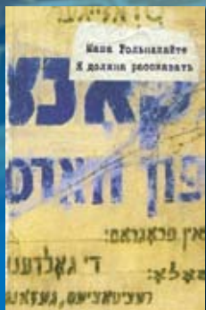
Маша Рольнакайте. «Я должна рассказать»