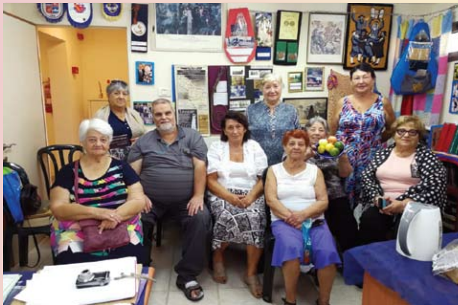
Экскурсанты из «теплого дома» в городском музее