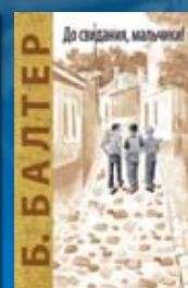
Борис Балтер. «До свидания, мальчишки!»