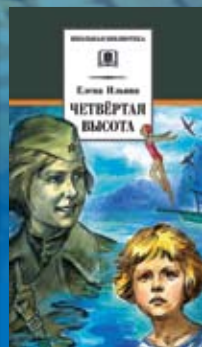
Елена Ильина. «Четвертая высота»