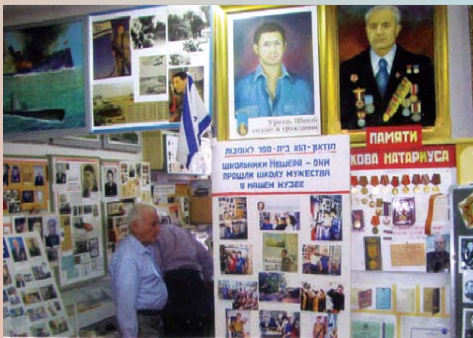
В зале музея – портретная галерея ветеранов Нешера и героев ЦАХАЛа

У стелы возле Музея проходят митинги в честь Дня Победы, в которых участвуют высокие гости города, страны и зарубежья. Мэрия продолжает оказывать поддержку инициаторам Музея.