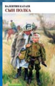
Валентин Катаев. «Сын полка»