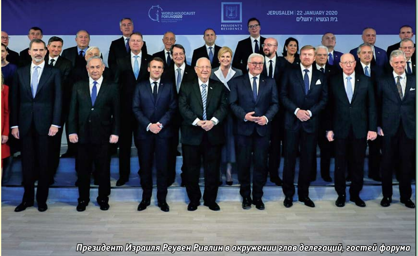
Президент Израиля Реувен Ривлин в окружении глав делегаций, гостей форума