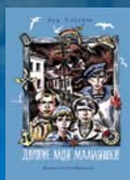
Лев Кассиль. «Дорогие мои мальчишки»