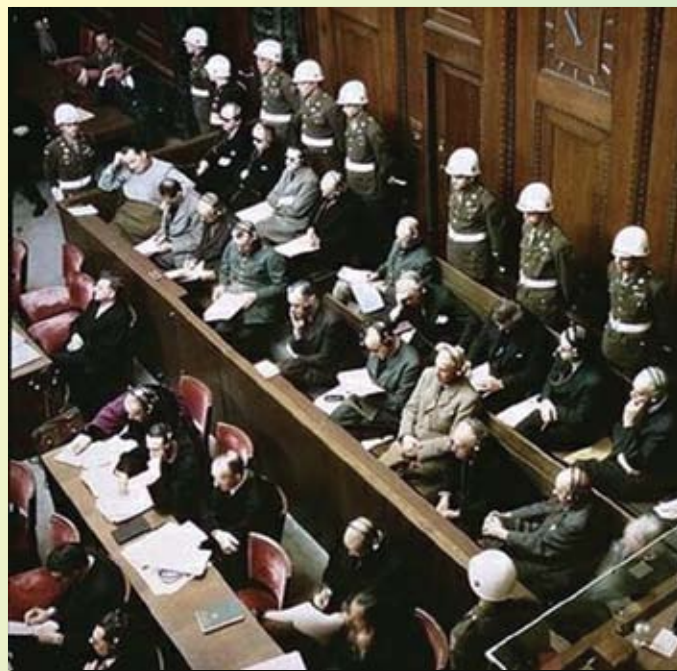
На Нюрнбергском процессе

На мой взгляд, некоторые положения, высказанные в интервью, не выдерживают никакой критики. Постараюсь в подтверждение этих своих слов использовать доступные доводы, ссылаясь на авторитетные источники.