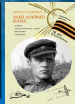
Виктор Голявкин «Мой добрый папа»