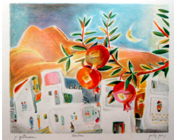
«Гранаты в Цфате»

Израильский культурный центр в Киеве до середины июля будет радовать посетителей выставкой работ Нахума Гутмана, знаменитого израильского художника и скульптора, основоположника нового стиля в изобразительном искусстве.