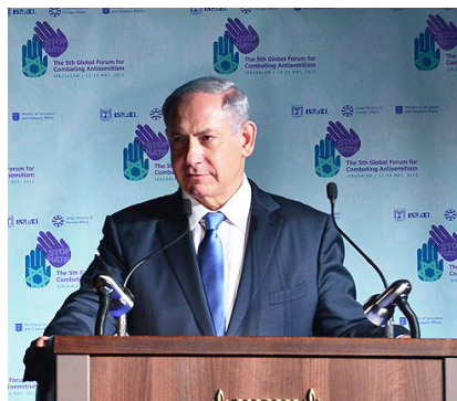
Выступает Б. Нетаньягу

Михаил Фельдман, Иерусалим