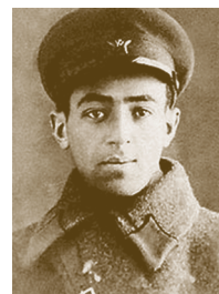
В.Этуш в чине лейтенанта