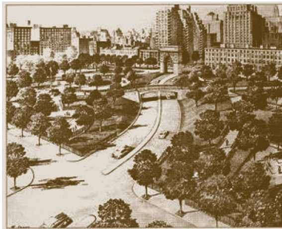
Вашингтон Сквер Парк