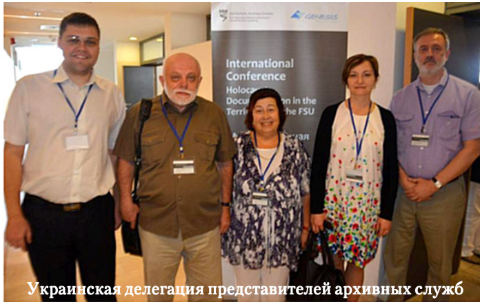
Украинская делегация представителей архивных служб

В мероприятии приняли участие представители архивных служб из стран бывшего СССР, а также израильские эксперты и специалисты.