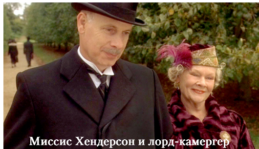
Миссис Хендерсон и лорд-камергер