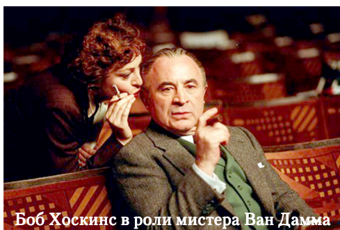
Боб Хоскинс в роли мистера Ван Дамма