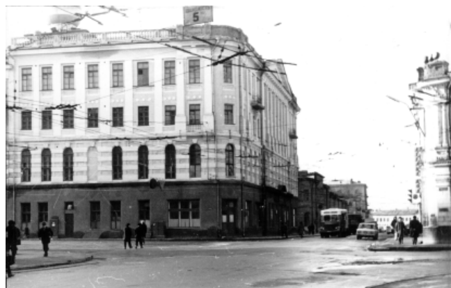
В этом здании на ул. Гамарника, 2 находилась гимназия