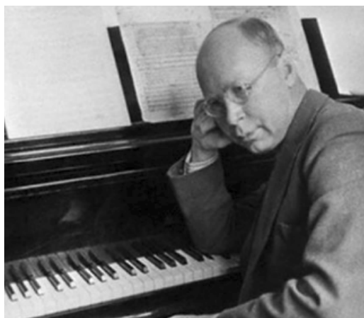
С.С. Прокофьев (23.06.1893-05.03.1953)

Как известно, 5 марта 1953 г. сдох Сталин.