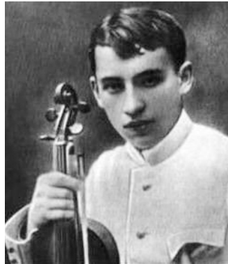
Исаак Дунаевский. 1919 год

рабочим графиком с десяти до девятнадцати часов и перерывом на обед. Молодой композитор круто меняет профессию и становится секретарем-корреспондентом Наркомвнешторга УССР. Как признавался сам Исаак Осипович — променял музыку на работу секретаря и устойчивый продовольственный паёк. Однажды, забывшись, он начертил в углу делового письма нотный ряд и набросал простенькую музыкальную фразу, родившуюся в его голове, и отправил письмо в Москву. Ответ пришёл телеграммой: «Ответьте, что значит восемь жирных точек и пять параллельных линий в левом углу сообщения. Такой шифр Наркомвнешторгу не известен. Сообщите, что вы хотите сказать».