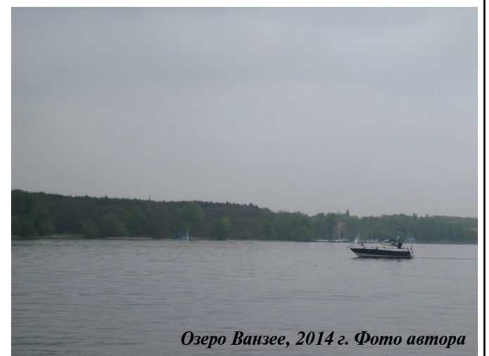
Озеро Ванзее, 2014 г.