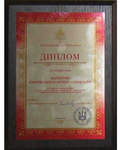
Диплом Всеукраїнської єврейської ради