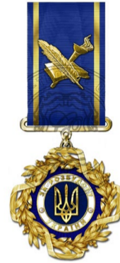
Орден «За розбудову України»