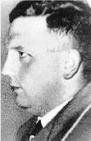
Др. Йозеф Бюлер (1904-1948)