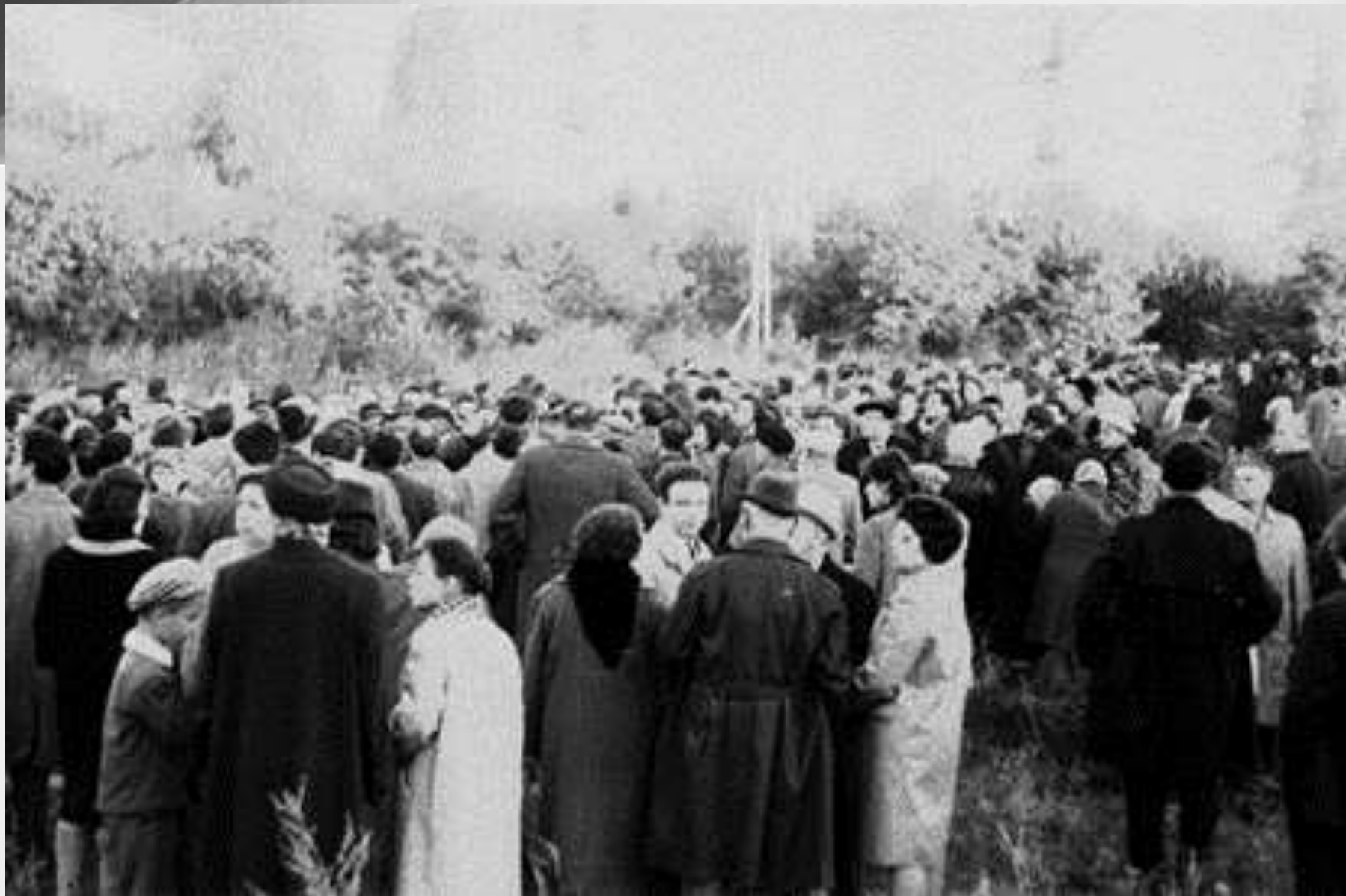
Публика на митинге