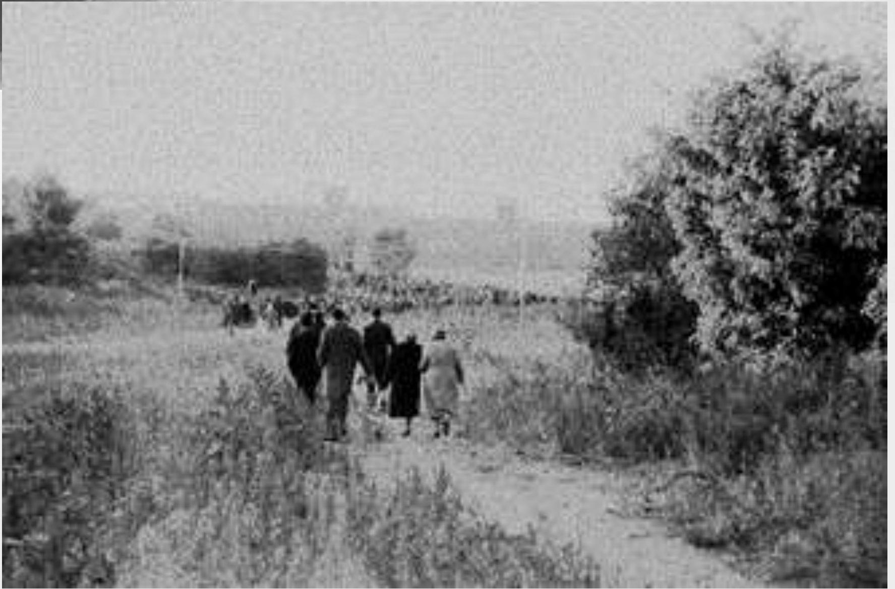
Публика идёт на митинг