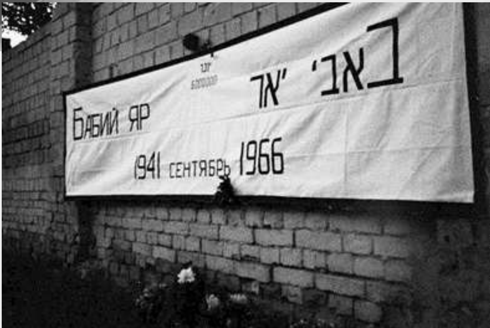
Плакат - объявление на стене бывшего еврейского кладбища