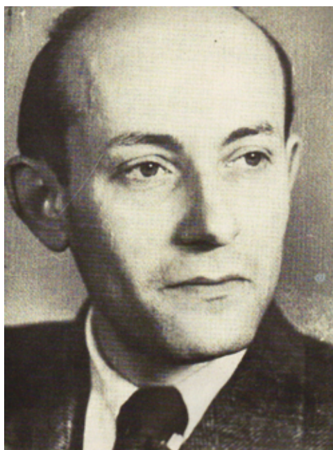
Хайнц Галинский (1912- 1992)

По рассказам сотрудниц, за «оставантов» хлопотал лично Президент Совета евреев в Германии Хайнц Галинский а также и еврейская община Берлина.