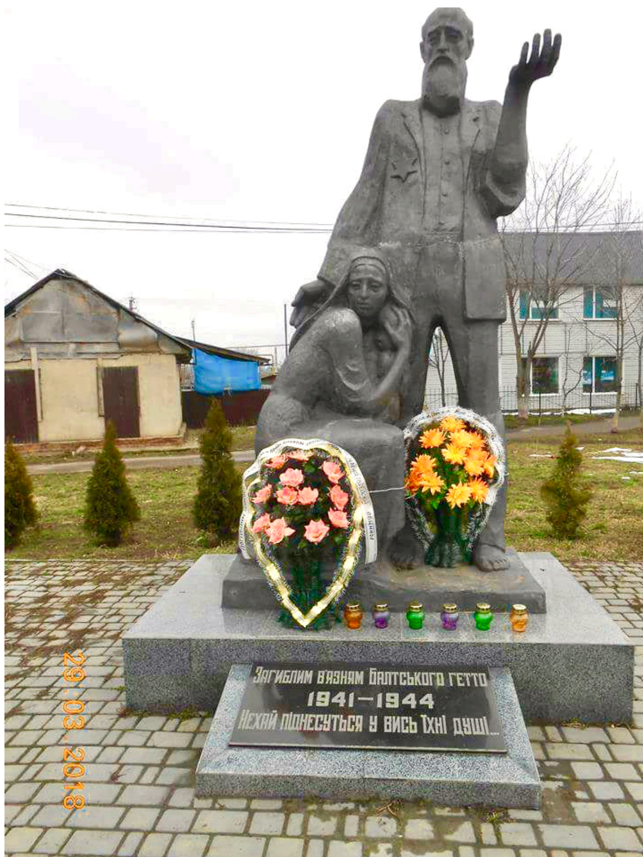
Памятник погибшим заключённым Балтского гетто

И уже через некоторое время можно было снова сказать: «Балта – городок приличный!»