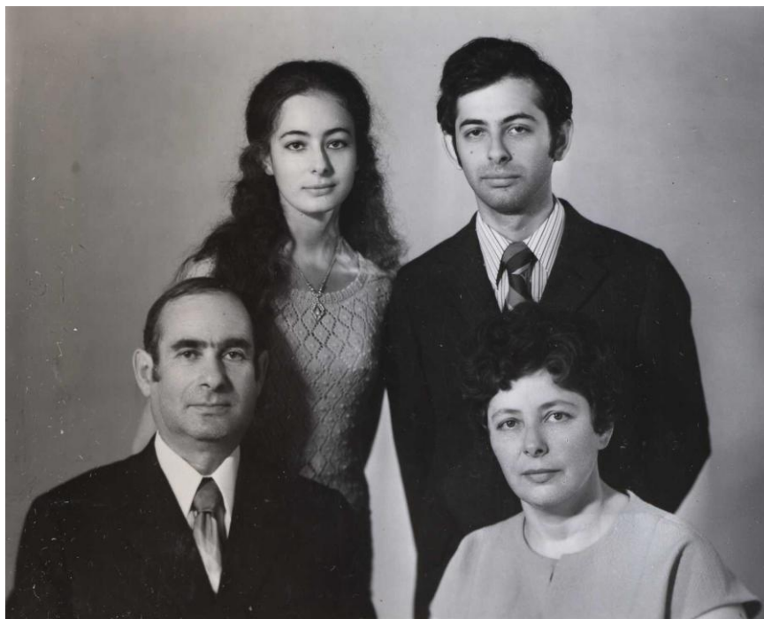
Наша семья. 1970г.