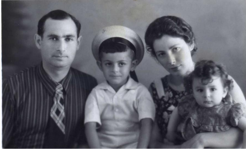
Наша семья. 1959г.