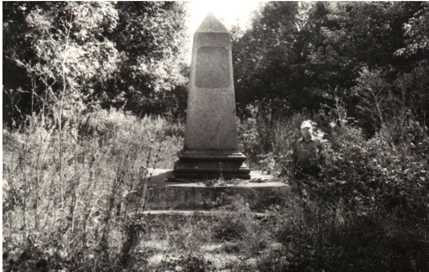
Памятник евреям, расстрелянным нацистами. Ильинцы. 1992г.