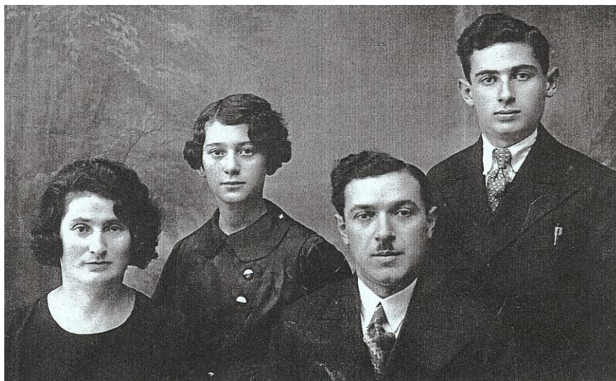
Семья моего мужа. Родителей и сестру расстреляли нацисты.