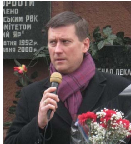
Виталий Богданов, консул Российской Федерации