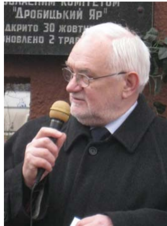
Ян Гранат, генеральный консул Республики Польша