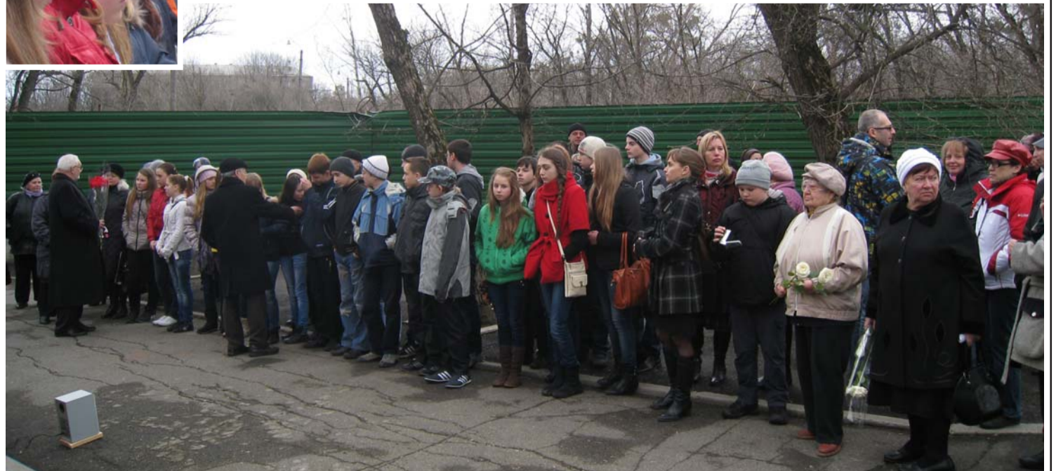
На месте бывшего гетто собрались учащиеся школ