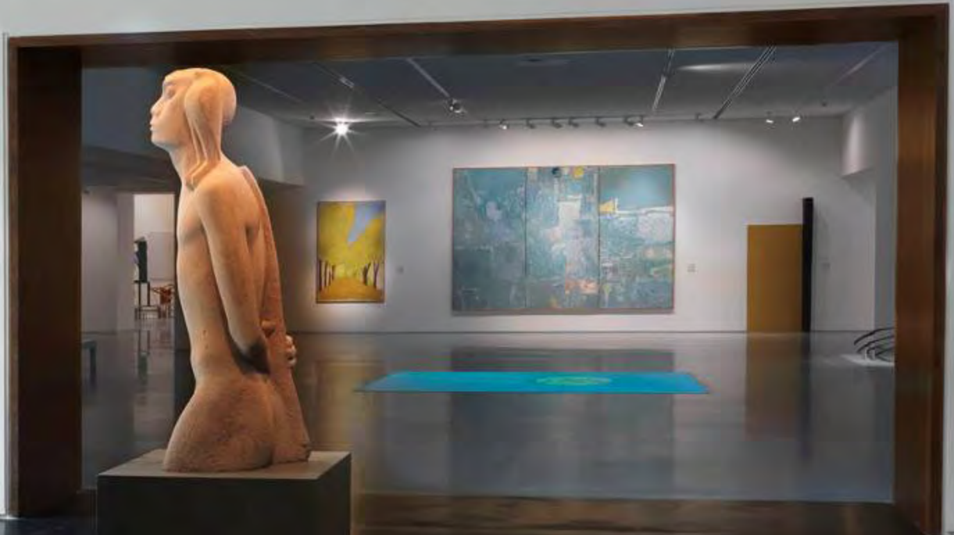
Edmond and Lily Safra Fine Arts Wing