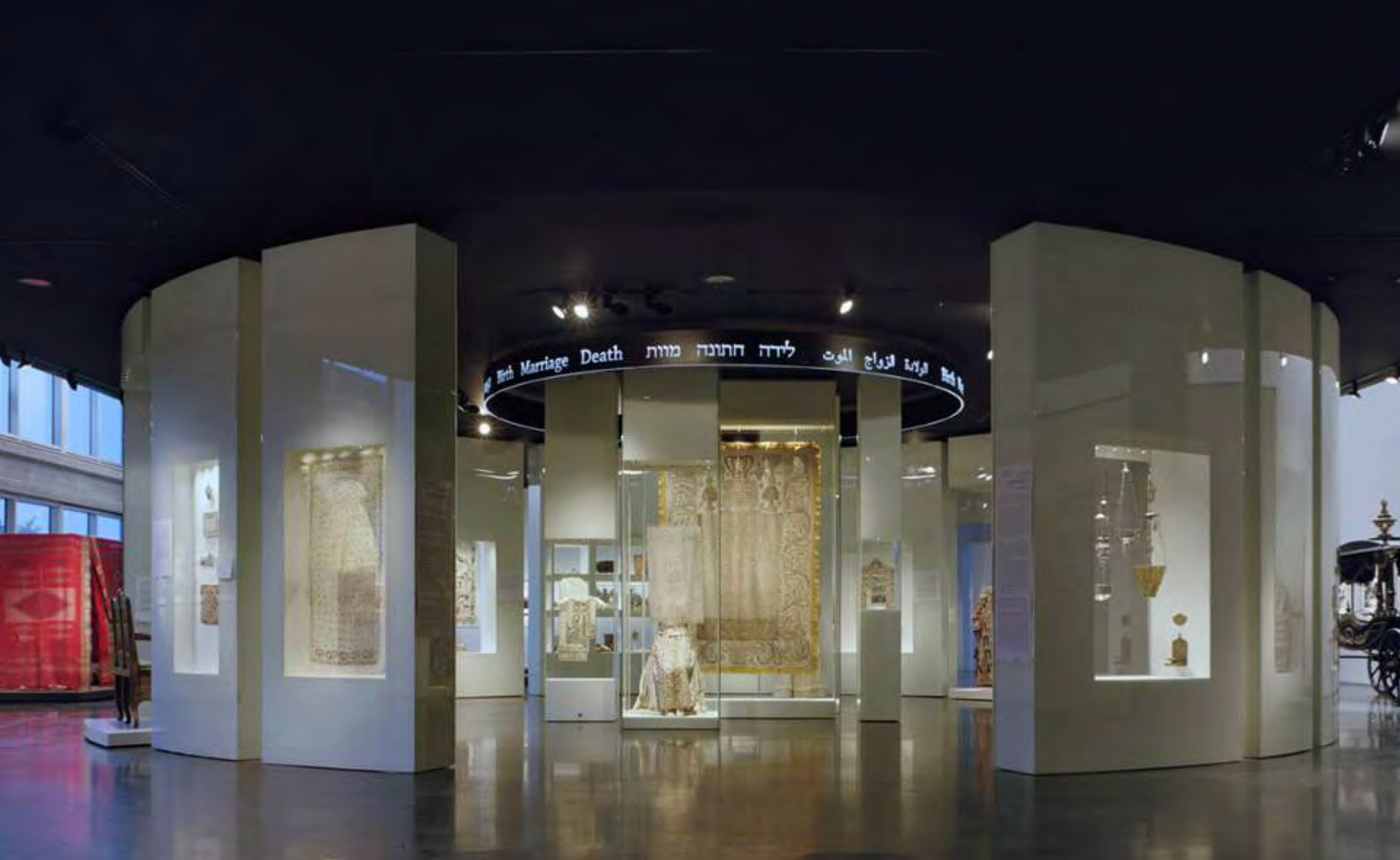
Jack, Joseph, and Morton Mandel Wing for Jewish Art and Life